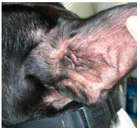
Abb. 2: Erytheme im äußeren Gehörgang.

Zur dritten Säule gehören z.B. Mikroorganismen, die die Entzündung aufrechterhalten, aber nicht verursachen. Diese konsequent zu bekämpfen, ist äußerst sinnvoll, aber alleine nicht zielführend. Daher ist Vorsicht geboten, wenn man sich auf die Behandlung der Infektion konzentriert. Dabei kann man womöglich die Ursachenforschung übersehen. Bei „Gelegenheitsohrenentzündungen“ mag man auf Ursachenforschung verzichten, sofern es sich um ein einmaliges Geschehen handelt.