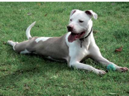
Abb. 3: Phänotyp Listenhund, Genotyp Listenhund (Tierschutzverein Hamburg)

Wird der Halter eines vermeintlichen „Listenhundes“ vor Gericht angeklagt, muss in den meisten Bundesländern bewiesen werden, dass der Hund tatsächlich der gelisteten Rasse angehört und sich der Besitzer im Sinne der landesspezifischen Hundeverordnung strafbar gemacht hat. Liegt kein Abstammungsnachweis vor oder sind die Elterntiere nicht bekannt, entscheidet ein Sachverständigengutachten anhand rassespezifischer Merkmale wie Phänotyp, Wesen oder Bewegungsablauf über die Rassezugehörigkeit. Potentieller Streitpunkt ist, dass solche Gutachten natürlich subjektiv sind und von der Erfahrung des Gutachters abhängen. Viele Kritiker sind zudem der Auffassung, dass die