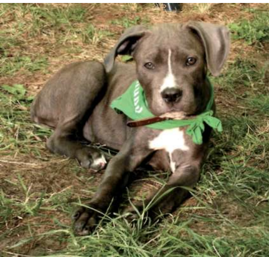
Abb. 2: Phänotyp Listenhund, Genotyp frei (Tierschutzverein Hamburg)

denachweis, Wesenstest für den Hund, Haftpflicht, Chipnummer. Als Strafmaß bei Verstoß gegen die jeweiligen Vorschriften können Freiheitsstrafen oder Geldbußen verhängt werden.