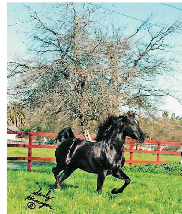
Morgan Horse Hengst "Juval"