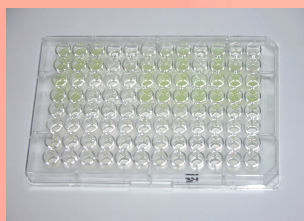
Figura 1: Antibiograma mediante microdilución.

Mediante microdilución se realizó el test de resistencia frente a cloranfenicol, amoxicilina + ácido clavulánico, enrofloxacina, ácido fusidínico, eritromicina, sulfonamida + trimethoprim, clindamicina, cefalexina, gentamicina y tetraciclina.