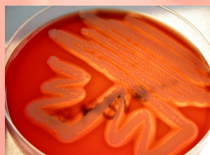
Figura 2: Cultivo en agar sangre con S. pseudintermedius